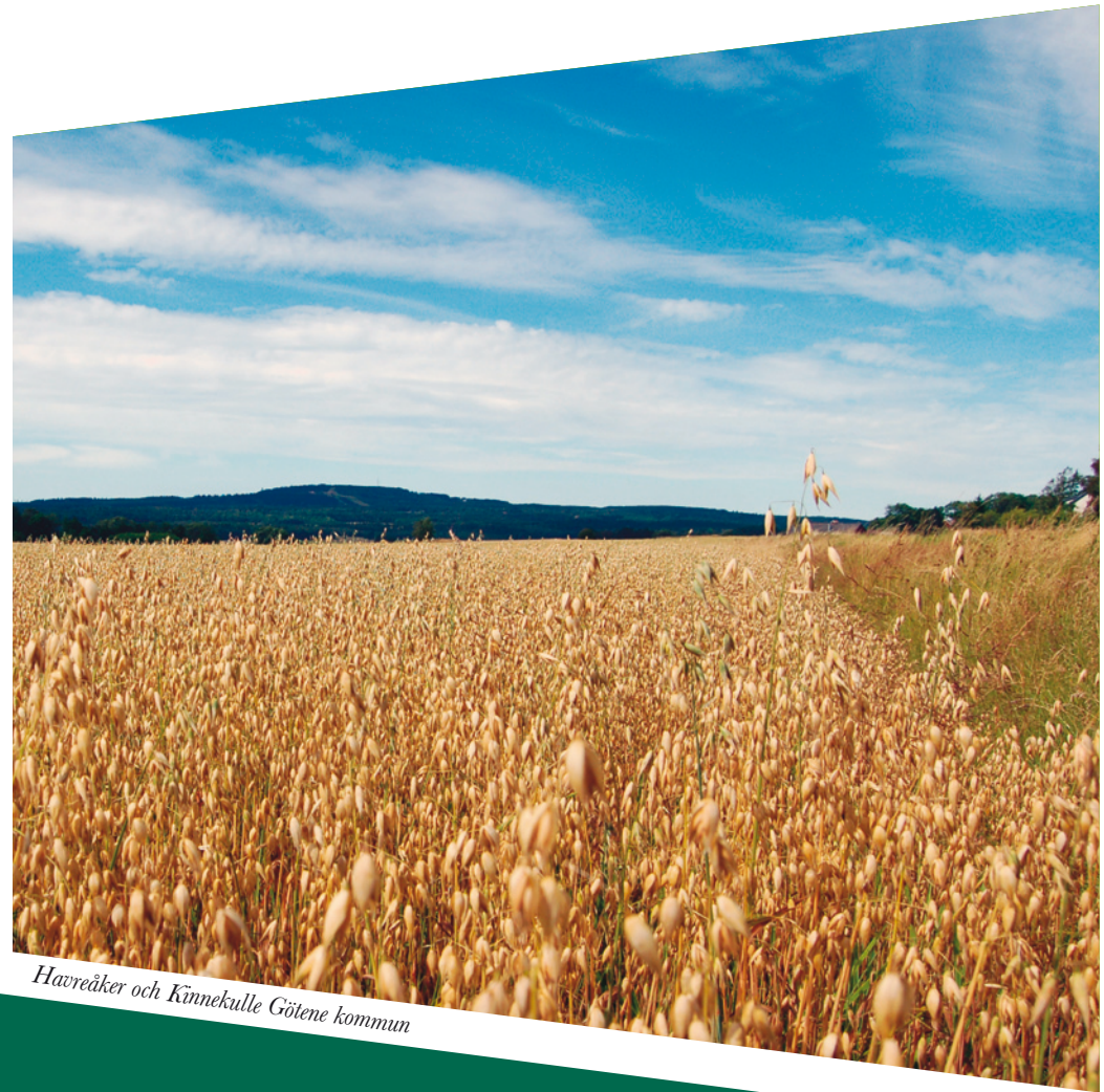
Havreåker och Kinnekulle Götene kommun