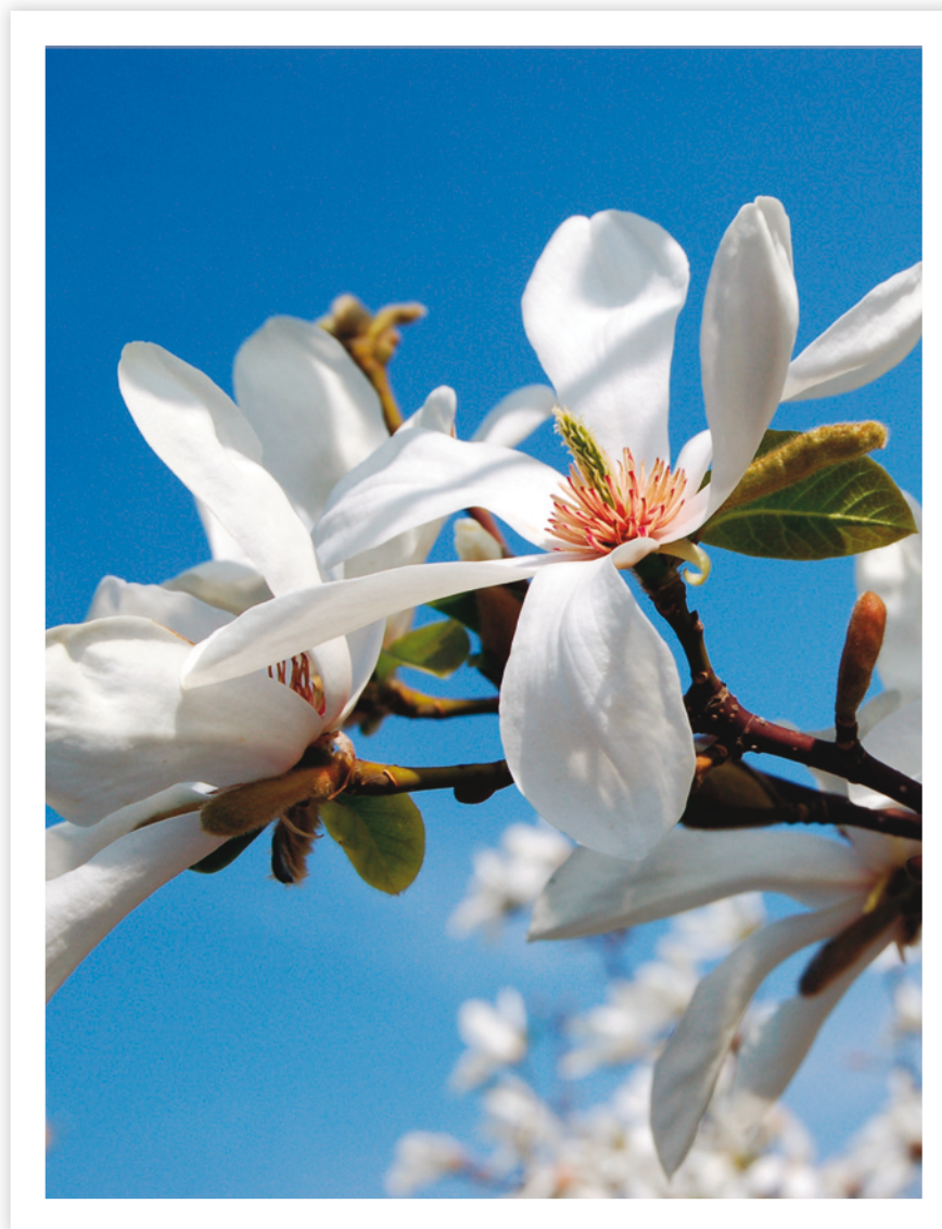
Magnolia Götene kommun

Driftkostnader för offentliga toaletter samt Husaby kiosk. Budgeten ingår i nämndens ram från och med 2019.